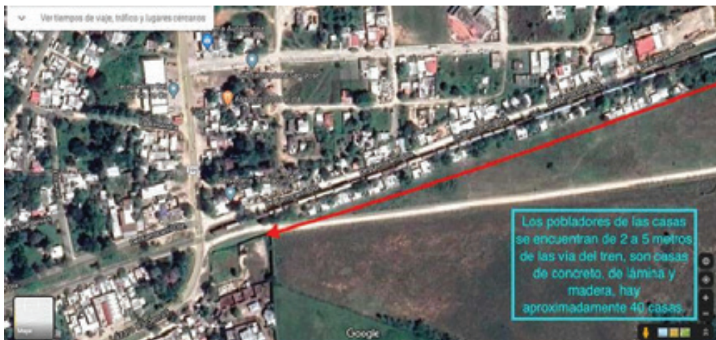
Mapa 5 – Lado Sur de Ave Ferrocarril, Palenque, Chiapas indicando posibles afectaciones.