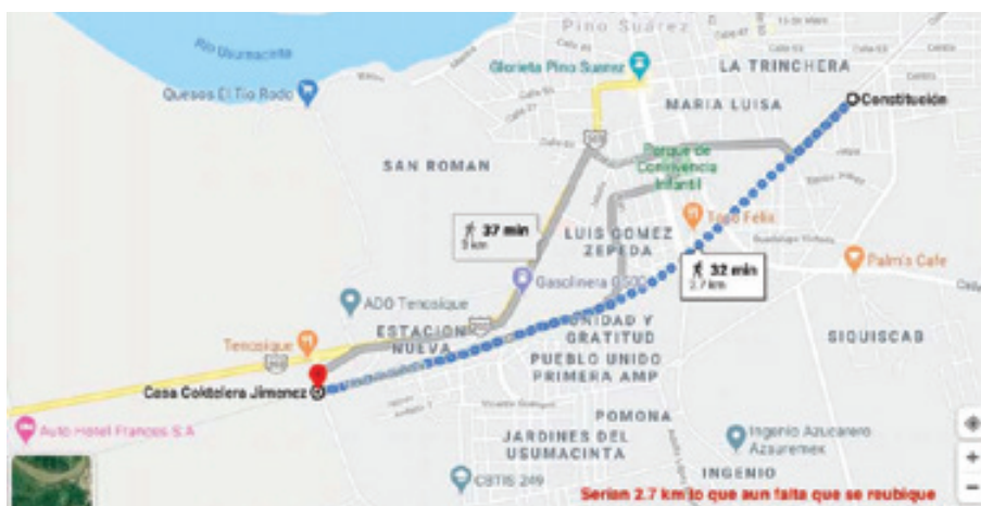
Mapa 12 – Tramo de 2.7 km con construcciones pendientes de su reubicación entre Casa Coktelera Jiménez y la Colonia Obrera.