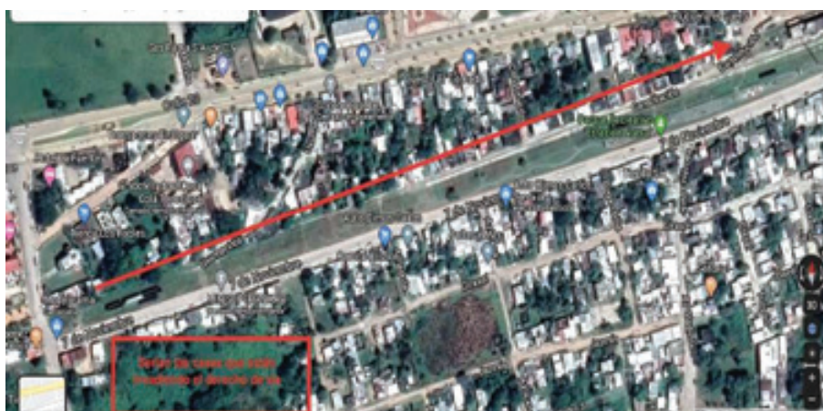
Mapa 14: Lado Norte de la vía del tren con afectaciones dentro del pueblo de Tenosique.

Las fotos a continuación corresponden a afectaciones indicadas por la flecha Mapa 14: