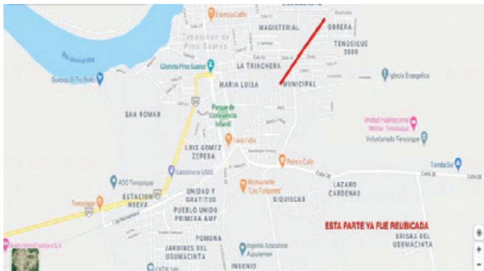
MAPA 10 – Reubicación de familias en el año 2003 desde la Colonia Municipal.

Las personas que hoy viven cerca de las vías activas del tren de carga a Mérida mencionan que en el año 2003 se realizó una reubicación de familias que vivían a las orillas de los rieles, o sea, se encontraban dentro de los 20 metros de cada lado, sobre el derecho de vía. Fueron desplazadas desde la Colonia Municipal y la Colonia Obrera hasta la Colonia San Juan 12 en las que se les dieron terrenos de 7 x 10 metros que les costaron $4500 pesos a cada familia ,(aún no queda claro si fue por parte del gobierno municipal, estatal o federal). No hubo una compensación por el abandono de las construcciones cercanas a la vía.