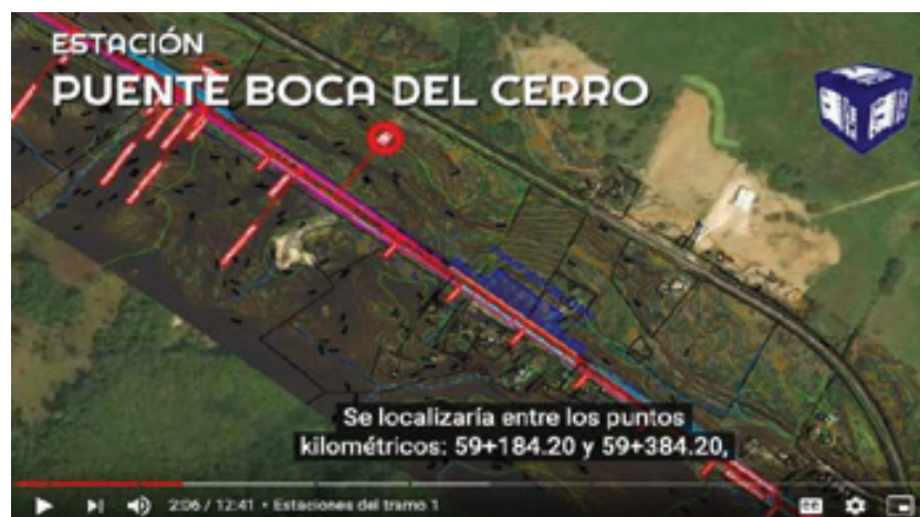
Mapa 7 – Ubicación de la nueva estación programada para Boca del Cerro, Tabasco.