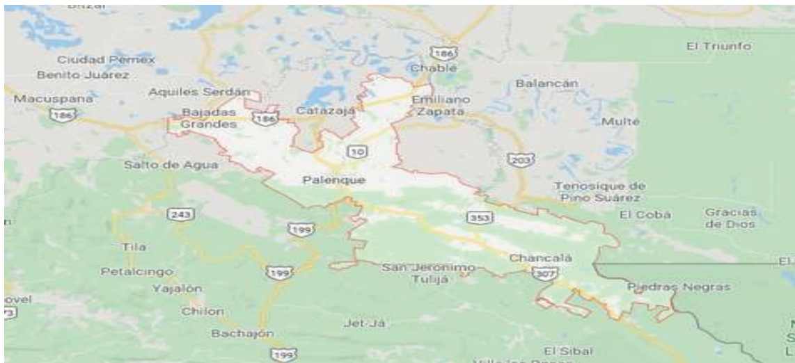
Mapa 1 – Municipio de Palenque, Chiapas

Palenque 1 fue incorporado al Programa Pueblos Mágicos en 2015 y su importancia para el turismo internacional es incuestionable por el sitio arqueológico cercano, pero el acceso ha sido problemático. Aquí arranca el primer tramo del proyecto Tren Maya, lo cual implica la anunciada construcción de una nueva estación con un centro comercial integrado, además de la rehabilitación de la vía (balasto, durmientes y rieles nuevos).