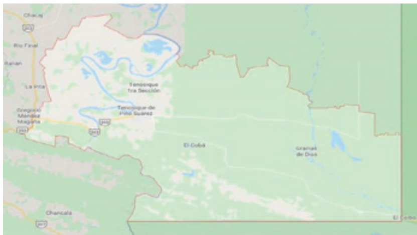
Mapa 9 – Municipio de Tenosique, Tabasco. Nótese El Ceibo en el rincón inferior derecho.

Tenosique se encuentra a 64 km al norponiente del puesto fronterizo de El Ceibo. Por esta frontera con Guatemala entran a México muchos migrantes bajo la vigilancia el Instituto Nacional de Migración. Han aumentado las solicitudes de entrar al país, y con la pandemia han complicado las resoluciones de las demandas de los migrantes llegando desde América Central. El municipio de Tenosique ocupa el 7.6% de la superficie del estado de Tabasco. Cuenta con 140 localidades y una población total de 55 600 habitantes. 6