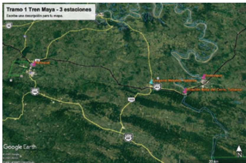
Mapa 6 – Región de las tres nuevas estaciones del primer tramo, Tren Maya.

El tramo Uno del Tren Maya no proyecta una nueva estación de categoría en el pueblo de Gregorio Méndez, Municipio de Jalpa, Tabasco (población: 1500), pero sí habrá una nueva estación pegado al puente de fierro sobre el Río Usumacinta en el lugar conocido como Boca del Cerro. Hubo una presa hidroléctrica programada aguas arriba del puente por la CFE en el sexenio de Miguel de la Madrid (1982.-88), proyecto archivado por el enorme tamaño del embalse proyectado, inundando sitios arqueológicos importantes (Yaxchilán y Bonampak) y tierras al lado del Río Usumacinta en el Petén de Guatemala.