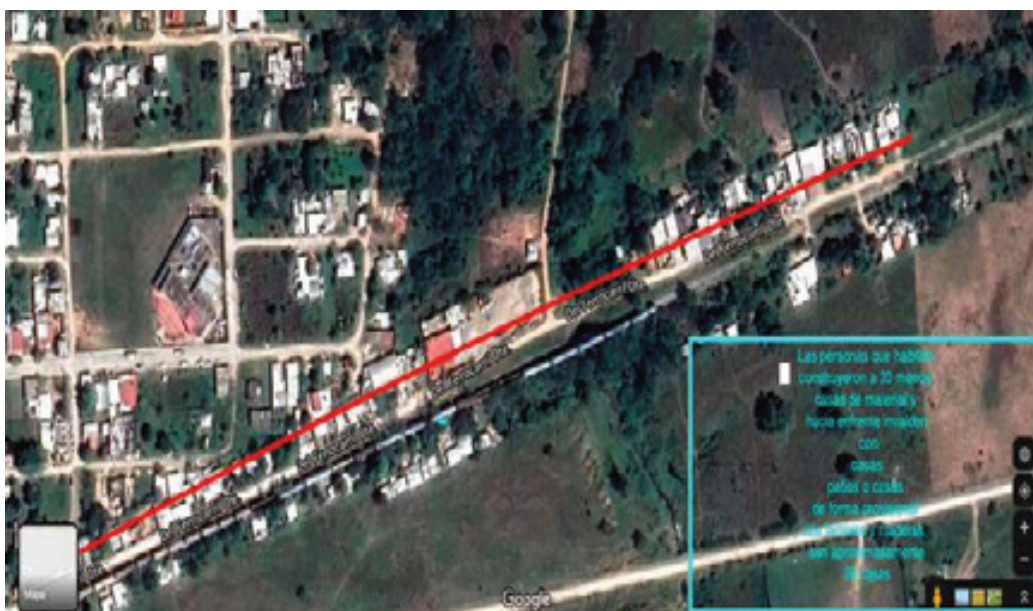
Mapa 4 – Lado Norte, Ave Ferrocarril, Palenque, Chiapas indicando posibles afectaciones.

Según fuentes oficiales, el tren pasaría por el cruce y de ahí pasaría por tierras de siembra hacia el antiguo aeropuerto (véase el Mapa 1). Aquí se ubicará la nueva estación del tren que tendrá 200 metros lineales de construcción. Autoridades han planteado el cambio de la cabecera municipal del Palenque cerca de la nueva estación, donde el plan difundido contempla un corredor comercial. No hay datos confiables aún sobre el número de familias y personas pendientes de su desplazamiento en este diseño de la obra.