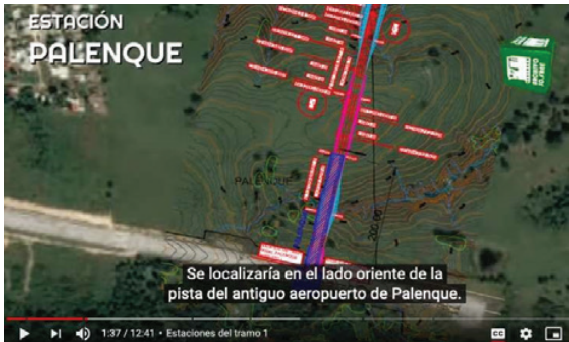
Mapa 2