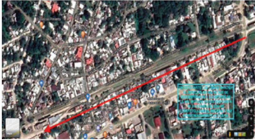
Mapa 5 – Avenida Ferrocarril Palenque, Chiapas – Flecha indica posibles afectaciones.

Todas estas casas serían afectadas si el tren entra al centro de Pakal-Ná, alrededor de unas 80 casas las cuales están construidas de concreto de 2 a 3 pisos, lámina galvanizada y madera.