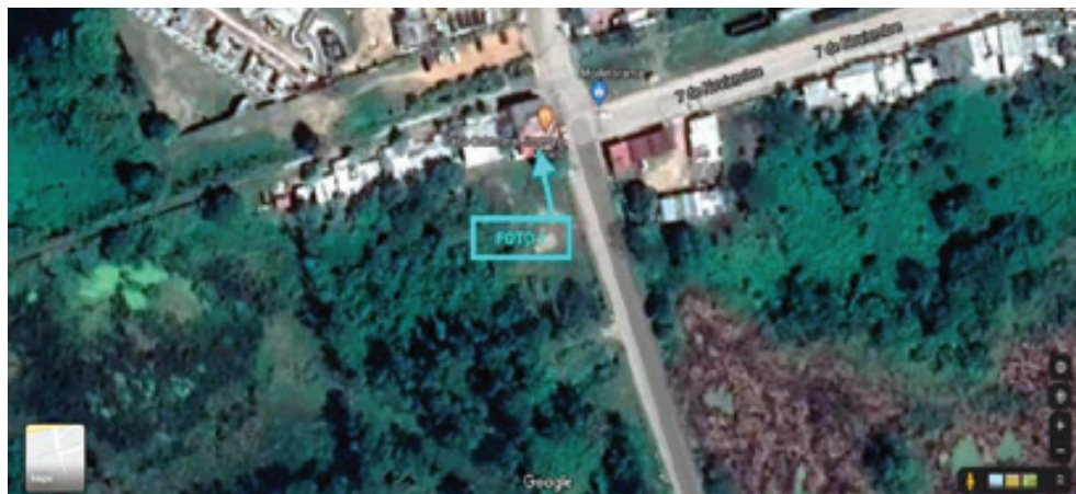
Mapa 13: Ubicación de una casa cercana a la vía (en base a imagen de Google Earth).

Actualmente, a mediados del mes de junio del 2020 se observan cuadrillas de 10 personas de limpieza que chapean (cortan el pasto con machetes y recogen basuras en las vías). Aún no se ve trabajo en la rehabilitación como tal, ni una ampliación de laderos dentro del pueblo de Tenosique. Hay ingenieros de los contratistas trabajando en las proyecciones del tren, utilizando camionetas con logotipos de FONATUR. Comentan que ya llegó la empresa que estará trabajando en la comunidad, pero aún no se sabe cómo se llama, ni cuál será su manera de proceder. Sólo saben de manera extraoficial que es una compañía china. Aparte, las noticias publican que hay “CONSORCIOS INTERESADOS”: ALB Energía, Cero Más Tres Ceros y el Instituto Politécnico Nacional; Key Capital y Senermex Ingeniería y Sistemas; Triada Consultores, Idom Ingeniería y Dirac. 14