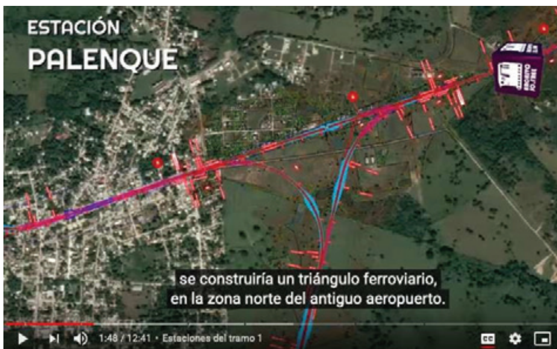
Mapa 3

La colonia Pakal-Ná es una localidad del municipio que abarca un área cercana a 260 hectáreas. Se encuentra a 3.6 km al Norte del actual centro de la pequeña ciudad de 111,000 habitantes.