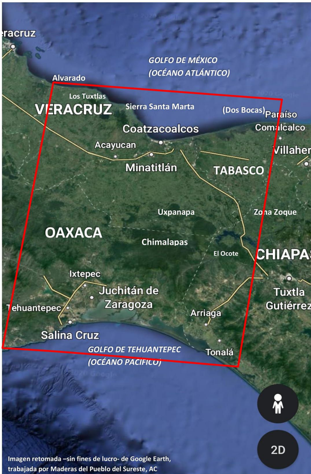
Imagen retomada –sin fines de lucro- de Google Earth, trabajada por Maderas del Pueblo del Sureste, AC